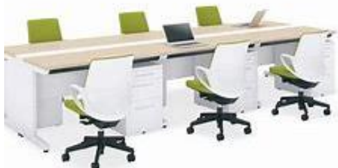
オフィスデスク・チェア